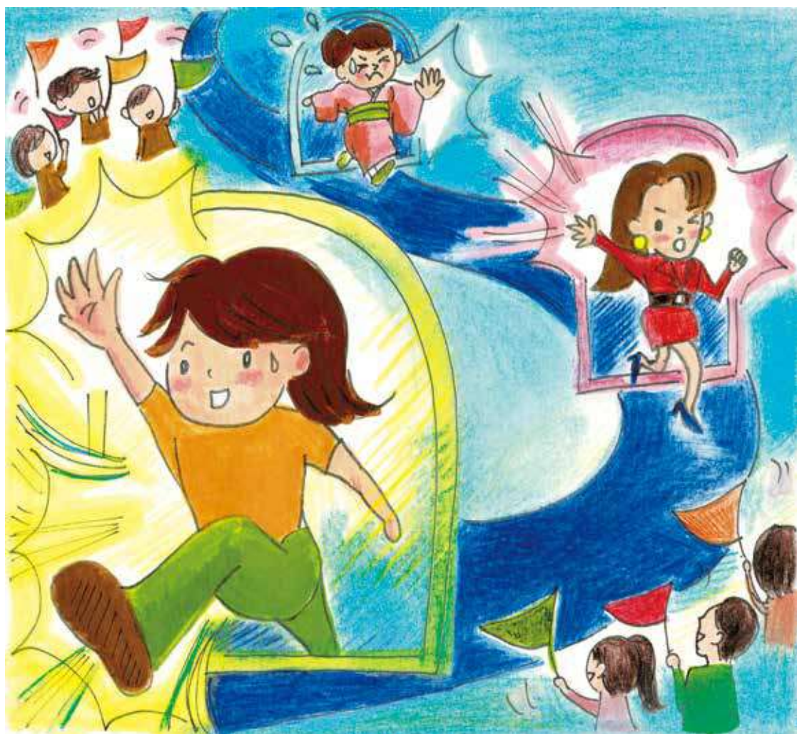
イラスト：ヒビノケイコさん